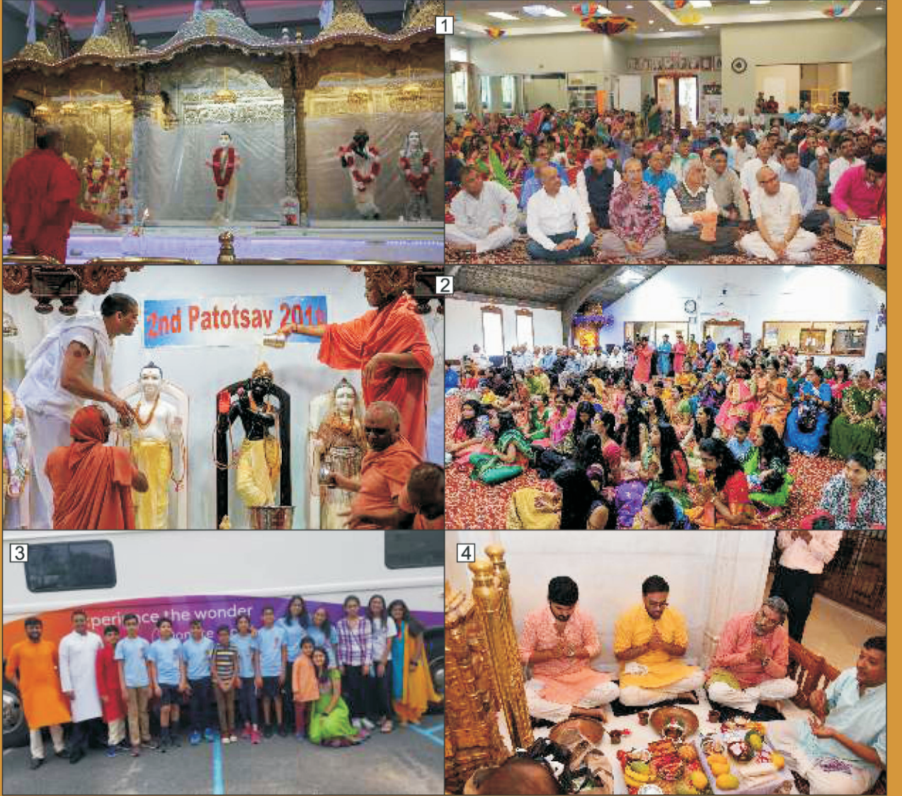
૧. શ્રી સ્વામિનારાયણ મંદિર રાલે(અમેરિકા)મંદિરના બીજા પાટોત્સવ પ્રસંગે ઠાકોરજીનાં અભિષેક દર્શન. ૨. પારસીપની (અમેરિકા) મંદિરના બીજા પાટોત્સવ પ્રસંગે ઠાકોરજીનાં અભિષેક દર્શન.૩.આઈ.એસ.એસ.ઓ. સેવા દ્વારા બ્લડ ડોનેશન કેમ્પ સમયે વોલીયન્ટર. ૪. અમદાવાદ મંદિરમાં શ્રી નરનારાયણદેવના કેશર સ્નાન પ્રસંગે પૂજા કરતાં યજમાન પરિવાર.